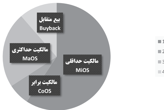
شکل ۳: نمودار دایره‌ای روش‌های ورود شرکت‌های چندملیتی خارجی در ایران

راهبرد و روش‌های ورود شرکت‌های سرمایه‌گذار خارجی در ایران به تفکیک نحوه مالکیت و مناطق جغرافیایی شرکت مادر در جدول (۳) آمده است. بیش‌ترین نوع مالکیت و روش استفاده توسط سرمایه‌گذاران مربوط به مالکیت حداقلی است که ۵۹ درصد از شرکت‌های خارجی سهم پایین‌تر از ۵۰٪ را در مالکیت و کنترل شرکت وابسته خارجی مستقر در ایران دارند. تنها ۲۳ درصد از شرکت‌های تابعه خارجی در ایران دارای مالکیت حداکثری شرکت مادر سرمایه‌گذارند. سهم بیع متقابل نیز از کل مجموع ۱۲۳ پروژه و شرکت خارجی ۱۱ درصد است که این نوع سرمایه‌گذاری بیش‌تر در بخش نفت و گاز و معادن صورت پذیرفته است.