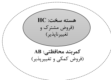
شکل ۲: اجزای اصلی برنامه پژوهشی لاکاتوس

وحدت هر برنامه پژوهشی را هسته سخت ۱ آن برنامه تضمین می‌کند. هسته سخت فرضیه‌های نظری، بسیار کلی، و مشترکی هستند که در تمام نظریه‌های آن برنامه پژوهشی موجودند، اما فرضیه‌هایی که در زنجیره نظریه‌ها قابل تغییر هستند، کمربند محافظتی ۲ آن برنامه را تشکیل می‌دهند. دانشمندی که هسته سخت را تغییر دهند، از آن برنامه پژوهشی خارج و وارد برنامه پژوهشی دیگری می‌شوند (Lakatos, 1976). برای روشن تر شدن برنامه پژوهشی، شکل (۲) اجزای اصلی دیدگاه لاکاتوس را به تصویر می‌کشد: